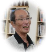
先代の社長 (島田社長のお父様)です。 「今年は息子をほめました」と笑顔でお話くださいました

全員が立ってお出迎えてくださいました。ちょっと恐縮! 電話がジャンジャン鳴ってお忙いところ、ありがとうございました