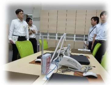
机の上は、いつもきれい! なぜならば共有スペースだから。 営業マンの席は決まっています